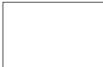
圖 1 XX