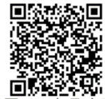
第三屆CAS肉品廚藝競賽 線上報名

備註：附件一、附件二應確實檢附 3 位參賽者及 1 位指導老師之閱讀個資蒐集告知事項簽名電子檔、授權同意書之簽名電子檔及選手學生證正面電子檔。